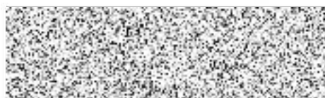
UVOK s.r.o. Zdeňka Ušáková