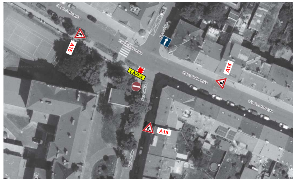
SCHEMATA PRO OZNAČENÍ PRACOVNÍCH MÍST V OBCI