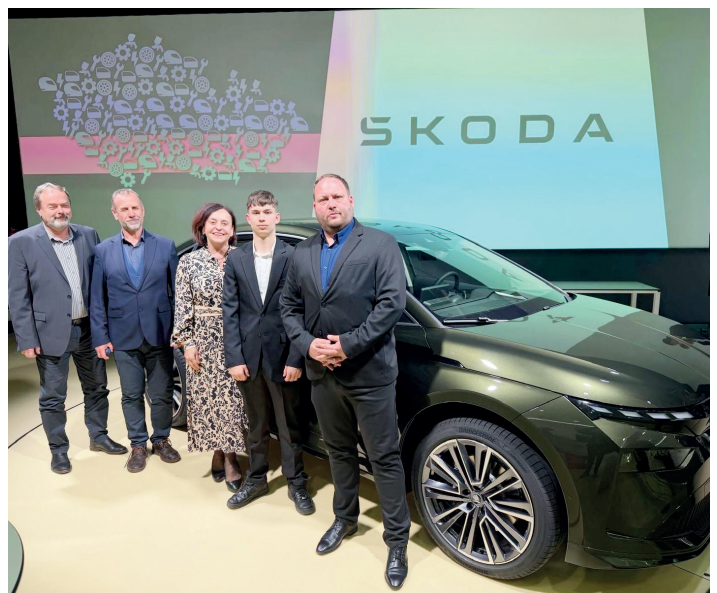
JAROSLAV ŠVOJGR SOŠ A SOU ROUDNICE

Účast ve finále představuje významný úspěch nejen pro samotného Lukáše, je zároveň i důkazem kvalitní práce našich pedagogů a mistrů odborného výcviku, kteří se studenty systematicky pracují s primárním cílem: připravit je co možná nejlepe na jejich budoucí profesní uplatnění.