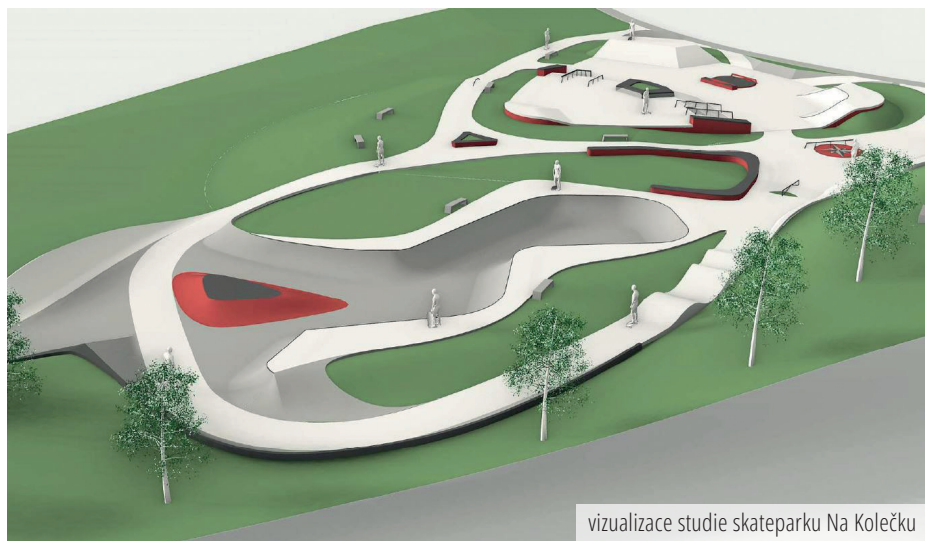
vizualizace studie skateparku Na Kolečku

Mezi hlavními body v oblasti strategického rozvoje města uvedl aktualizace strategického plánu a energetické