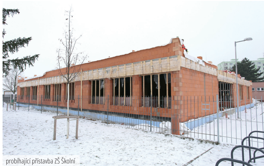
probíhající přístavba ZŠ Školní