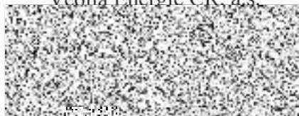
Tobola MSc. obchodní ředitel, dle základě pověření