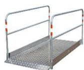
přechodová lávka pro pěší