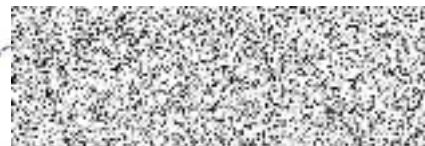
Zhotovitel Ing. arch. Petr Vávra