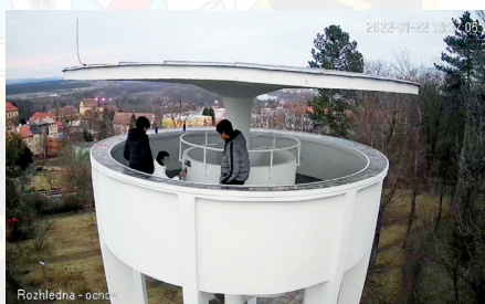
MARTIN MÜLLER VELITEL MĚSTSKÉ POLICIE

■ 22. 1. 2022 - 16:30 hod. - pomocí městského kamerového dohlížečského systému byly na Kratochvílově rozhledně zjištěny tři osoby mongolské státní příslušnosti, které posprejovaly její ohoz. Přímo na místě byly hlídkou městské policie zadrženy a pro důvodné podezření ze spáchání přečinu poškození cizí věci předány k dalšímu opatřením Policií ČR.